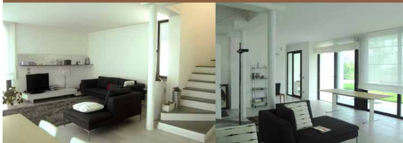
Sopra, il soggiorno presente al piano terra con affaccio sul giardino.