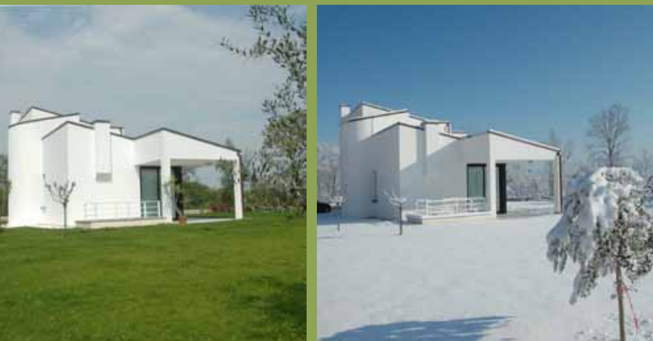
Esterno della villetta unifamiliare caratterizzata dal bianco assoluto.